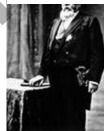
Armand Fallières 1841 / 1931

Cette "sélection à la source" ne suffisait pourtant pas à masquer la réelle difficulté de l'examen ; en effet, en 1920, un tiers des élèves sortait de l'école avec le certificat. Le nombre limité de candidats, la proportion restreinte de lauréats cantonnaient donc le C.E.P. dans un rôle de sélection d'élites privilégiées. Résultat bien éloigné de la généreuse ambition du législateur de 1882.