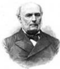
Jules Grévy 1807/1891

● – "Les Bataillons scolaires" : convaincus que le désastre militaire de Sedan (1870) est imputable à l'infériorité de l'instruction militaire, les républicains se rangent à l'idée d'une armée forte, issue du peuple. C'est dans ce renouveau patriotique que le décret du 6 juillet 1882 signé par Jules FERRY, crée les 'bataillons scolaires' dans les écoles comptant de 200 à 600 élèves de 12 ans.