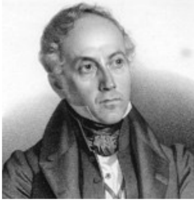
François Guizot (1787-1874) Ministre de l'Éducation Publique de 1832 à 1837.

Art. 1 ■ L'instruction primaire et élémentaire comprend nécessairement l'instruction morale et religieuse, la lecture, l'écriture, les éléments de la langue française et du calcul, le système légal des poids et mesures. L'instruction primaire supérieure comprend nécessairement, en outre, les éléments de la géométrie et ses applications usuelles, spécialement le dessin linéaire et l'arpentage, des notions des sciences physiques et de l'histoire naturelle applicables aux usages de la vie, le chant, les éléments de l'histoire et la géographie, et surtout de l'histoire et de la géographie de la France. Selon les besoins et les ressources des localités, l'instruction primaire pourra recevoir les développements qui seront jugés convenables.