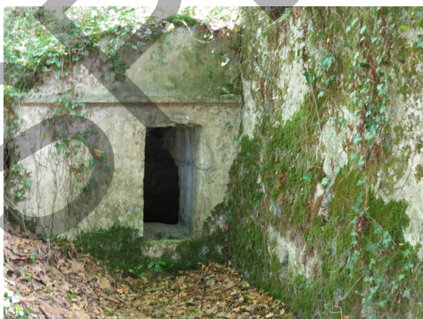
La fontaine Gassian La fontaine de Baure

Les participants ont pu profiter de l'exposition présentée par Alain Forsans (Moulins 64) et d'un diaporama monté par MCLVL et commenté par André Arriau. La municipalité a offert un apéritif pour clôturer la matinée. Le bilan est très positif, tant au point de vue de la participation que de la satisfaction des participants.