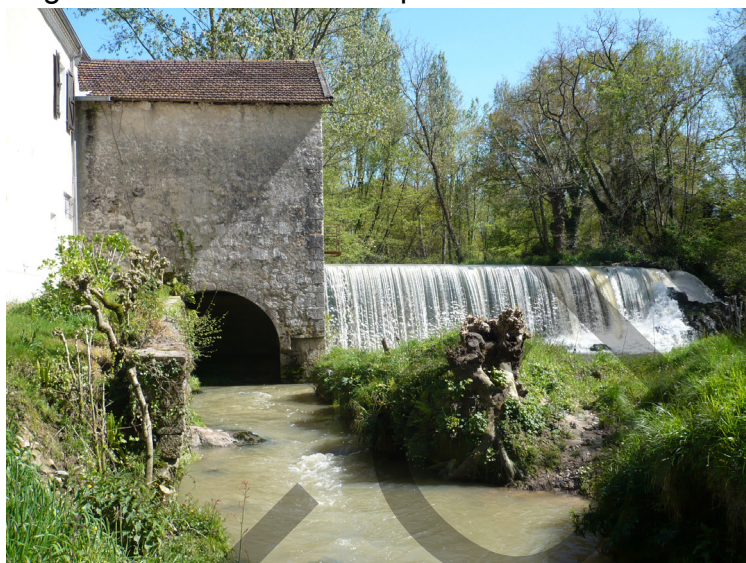
Le moulin Lajus