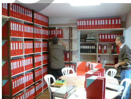
Notre local à Loubieng : Réunions Archives Informatique...