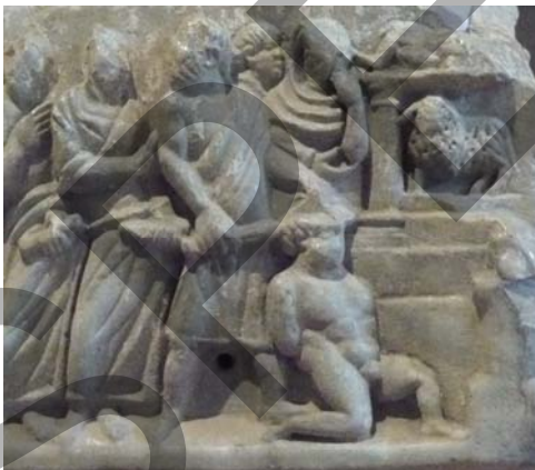
Détails du sarcophage du V e siècle qui sert d'autel à Lucq de Béarn : Le sacrifice d'Abraham et Adam et Eve

Il s'implique même personnellement dans la construction de nouvelles églises et parviendra peu à peu à faire de la religion chrétienne une religion d'état dont il s'érige en chef. C'est à son initiative et sous sa présidence qu'est convoqué le concile de Nicée en 325 mettant fin à l'hérésie de l'Arianisme et où a été conçu le « Crédo » attestant de la nature divine et humaine du Christ