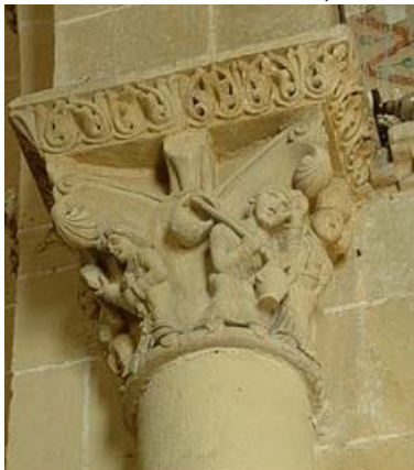
les pèlerins de St Jacques sur un chapiteau de la cathédrale de Lescar

A cause de l'occupation d'une grande partie du territoire par les Arabes musulmans, les premiers chemins étaient cantonnés au nord de l'Espagne, longeant les Pyrénées. La progression de la Reconquista a permis de sécuriser davantage de chemins et de faire de celui de Compostelle un des trois grands pèlerinages chrétiens, au même titre que celui de Terre sainte ou de Rome.