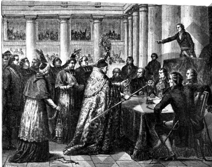
Les évêques prêtent le serment constitutionnel devant l'Assemblée

1790 – les curés qui refusent de prêter serment à la Constitution sont dits réfractaires . Ils doivent s'exiler.