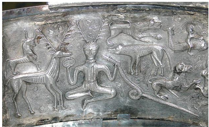
Cernunnos, avatar du dieu Lug tenant dans sa main droite un torse et dans l'autre un serpent ( Chaudron de Gunderstrup -Danemark Ile siècle av. J.-C.)

Ceux-ci, révélés un peu par les auteurs latins, bien plus par les traditions irlandaises qui les ont conservés plus