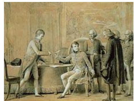
Signature du Concordat entre la France et le St Siège- 15 juillet 1801 François Gérard (1770 - 1837)

1801 – le Concordat permet de nouveau l'exercice des cultes catholique et protestant.