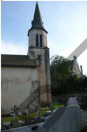
A côté de la maison d'abbadie, l'église de Laâ, entourée de son cimetière

Il a fallu attendre les IXe et Xe siècles pour voir apparaître les premières églises paroissiales. L'obligation d'enterrer les morts en terre chrétienne a fait que toutes ces églises étaient entourées de leur cimetière. Ces ensembles église et cimetière, construits par des particuliers (descendants ou successeurs des colons romains ?) et sur des terrains leur appartenant sont demeurés en leur possession et ils ont formé avec l'habitation du propriétaire, ce que l'on a appelé les abbadies ou abbayes laïques .