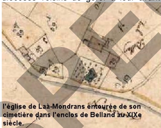
l'église de Laà-Mondrans entourée de son cimetière dans l'enclos de Belland au XIX e siècle.

« Gaston II de Foix, vicomte de Béarn accorde le 13 juillet 1340, à Pierre seigneur de l'abbadie de Laà, "la permission de bâtir sa maison de pierres et de faire les fortifications qu'il voudrait". ( B 672 fol 41 et 88)