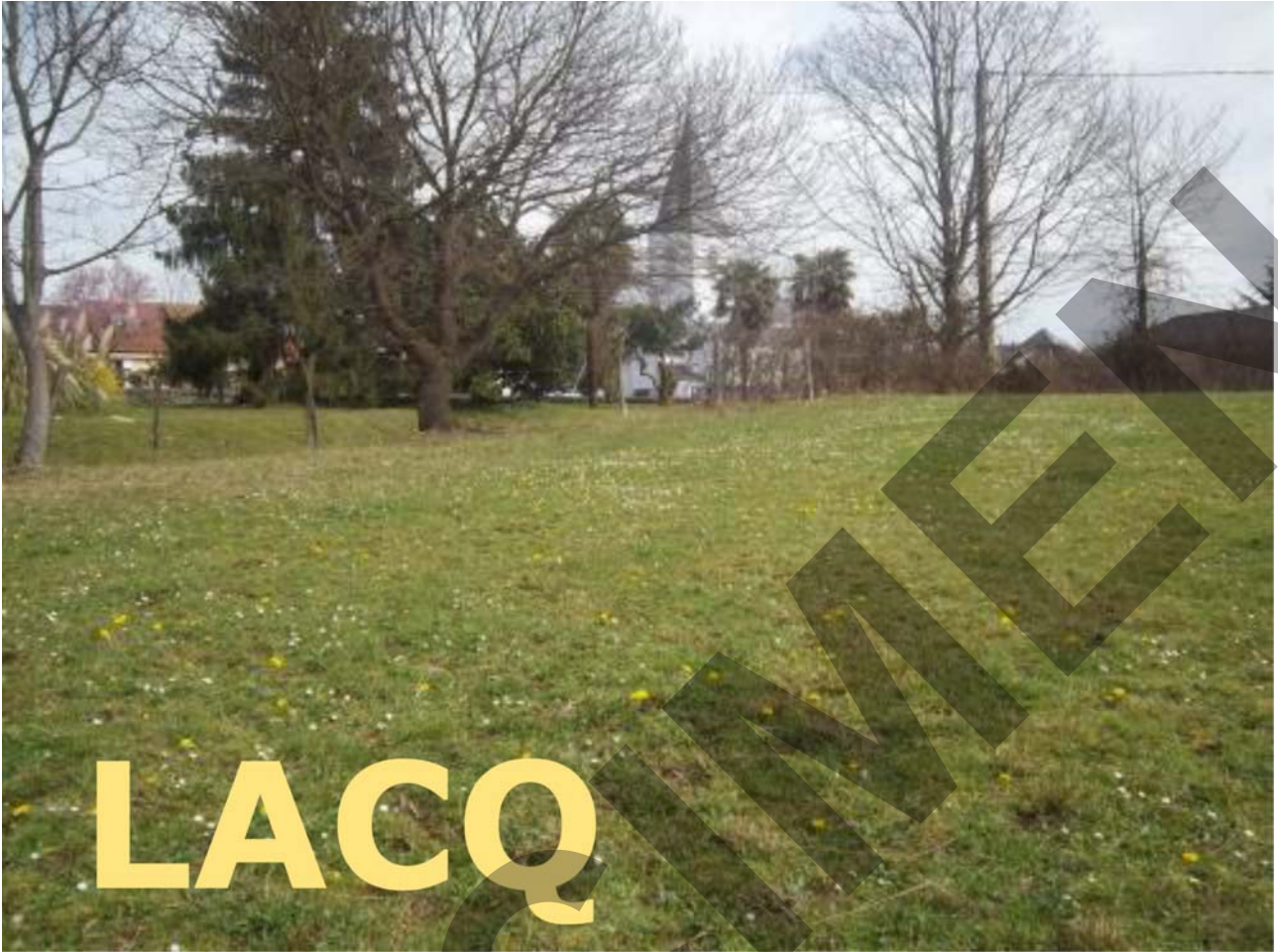
Une vue de l'église actuelle depuis le pré de Saint-Faust