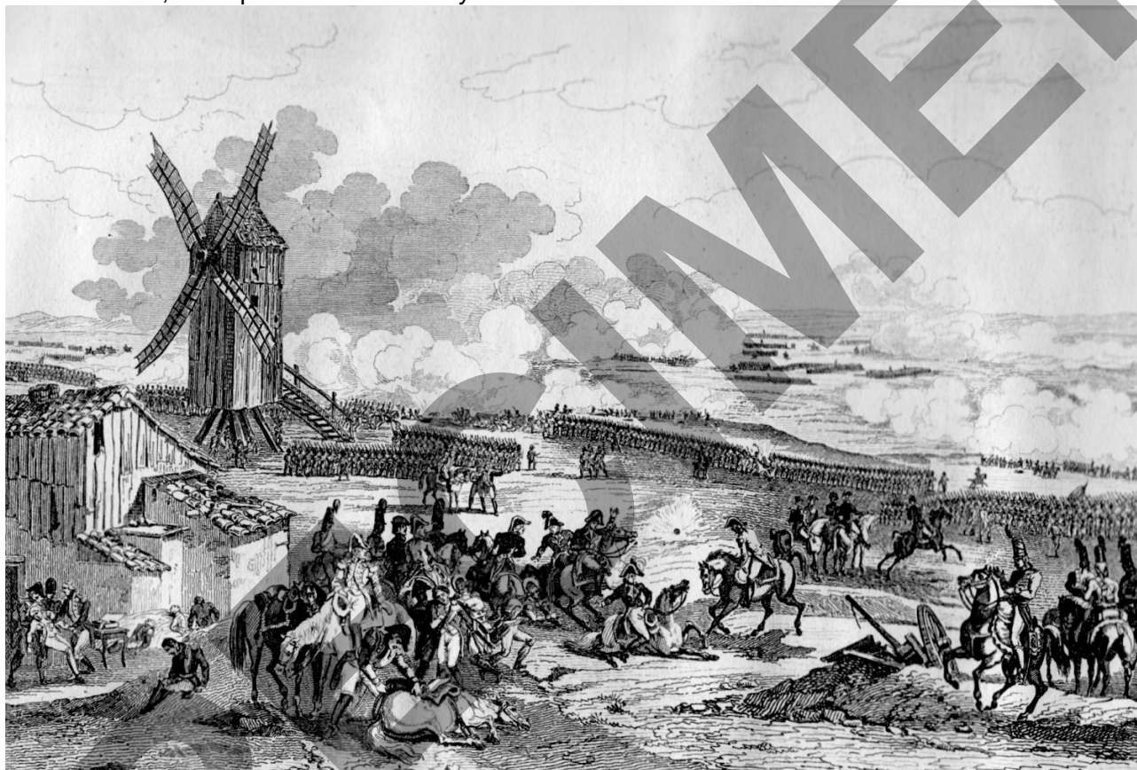
Gravure représentant la bataille de Valmy extraite de l'ouvrage de A. Hugo : "Histoire des Armées Françaises de terre et de mer de 1792 à 1833" – (Paris - 1835)

Le lendemain, 21 septembre 1792 la royauté était abolie en France.