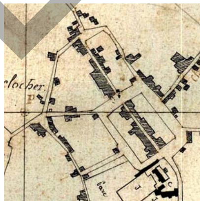
Ancien cadastre du bourg de Maslacq