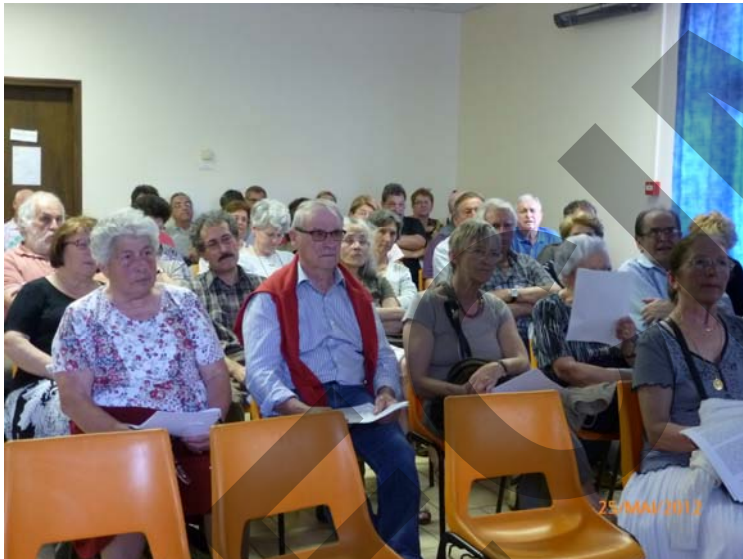
Le public salle Ménat