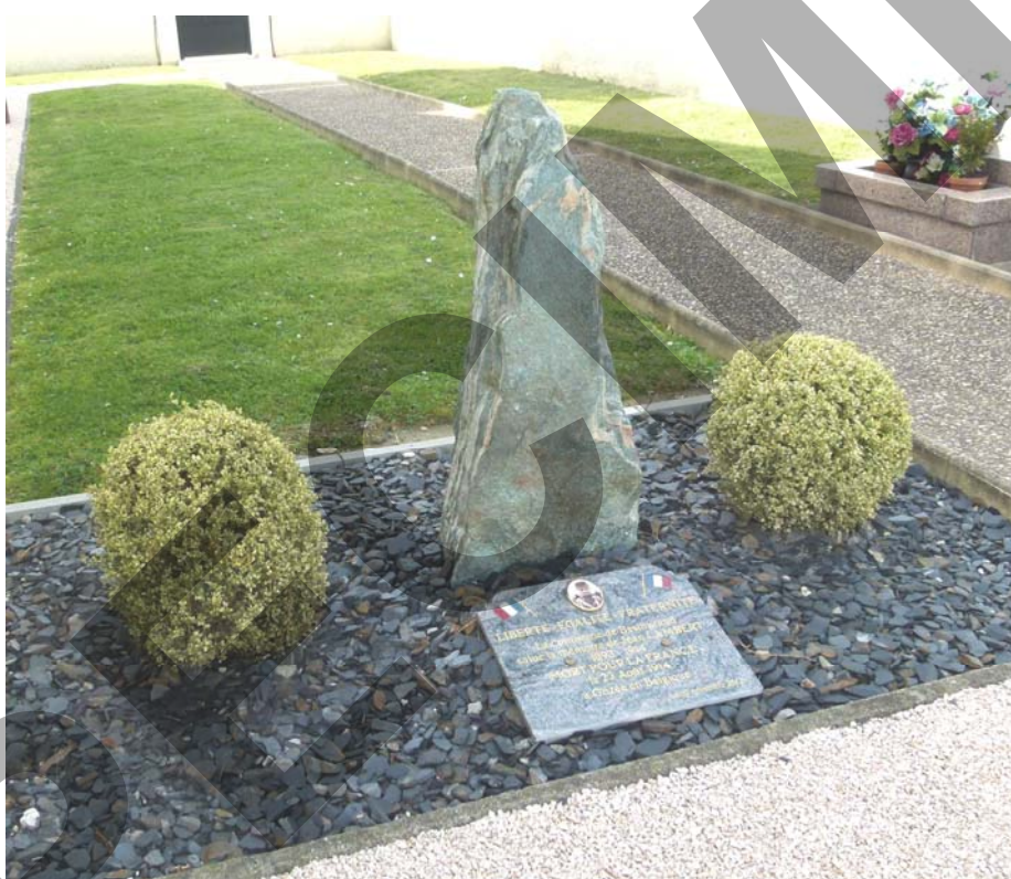
Stèle commémorative de BESINGRAND