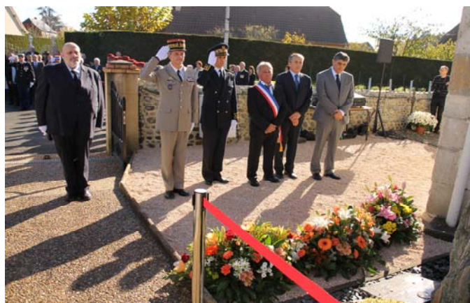
Cérémonie du 10 novembre 2012