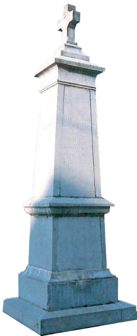
Monument aux morts de Maslaccq.

Les monuments aux morts de notre canton, souvent réalisés par les mêmes artisans ont d'une commune à l'autre, un air de ressemblance. Tous sont marqués par les tendances de l'époque où prévalait la nostalgie des modèles gréco-romains et égyptiens, ils sont pourtant bien différents. Le peu de moyens financiers a fait renoncer de nombreuses communes à l'art statuaire, privilégiant l'utilisation des symboles, exprimant quelques fois leurs désirs de perfection dans le choix des matériaux.