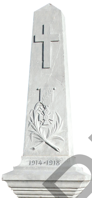
Monument aux morts de Mourenx.