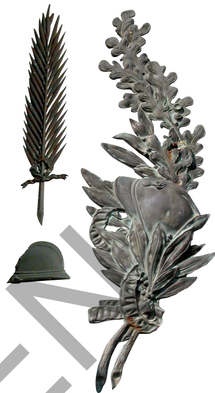
Monuments aux morts de Vielleségure et de Loubieng.

En décidant de les construire ainsi, en dehors du cimetière, avec cet espace privé, les conseillers municipaux se sont-ils rendus compte qu'ils dédiaient à ceux qui avaient par leur mort libéré notre pays, une parcelle de notre territoire ? Petite parcelle, mais qui leur appartiendra éternellement. Le symbole de l'érection de ces monuments n'en a été et n'en restera que plus fort.