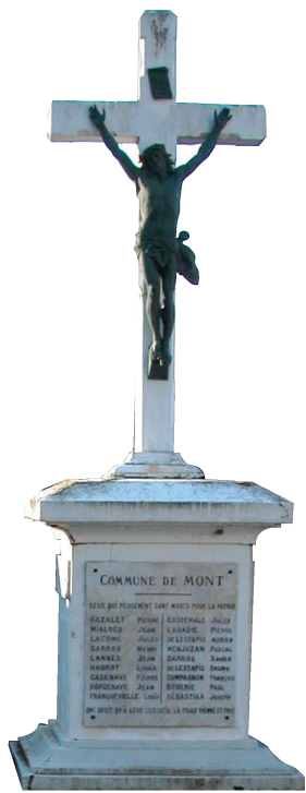
Monument aux morts de Mont.